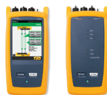
Тестер для определения оптических потерь CertiFiber® Pro (OLTS)