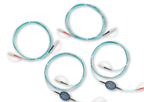
Эталонные шнуры Encircled Flux (требуются согласно стандартам)