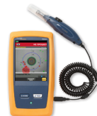
FI-7000 FiberInspector™ Pro