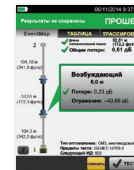
OptiFiber® Pro EventMap