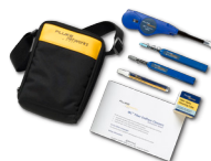
Комплект для очистки оптического кабеля